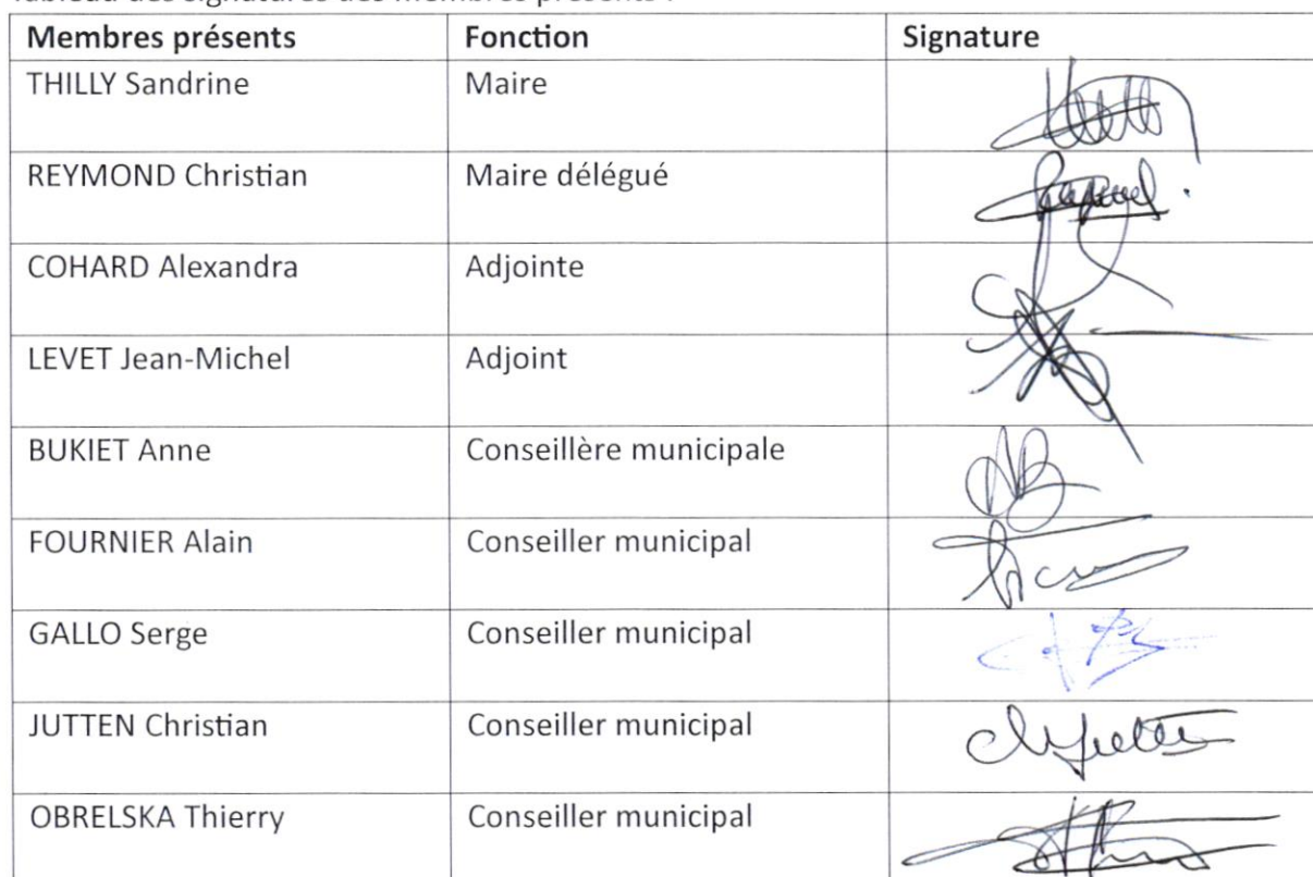
Tableau des signatures des membres présents :

Fait et délibéré le 10 janvier 2025 et ont signé les membres présents